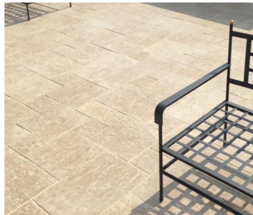
Pierre de Bourgogne